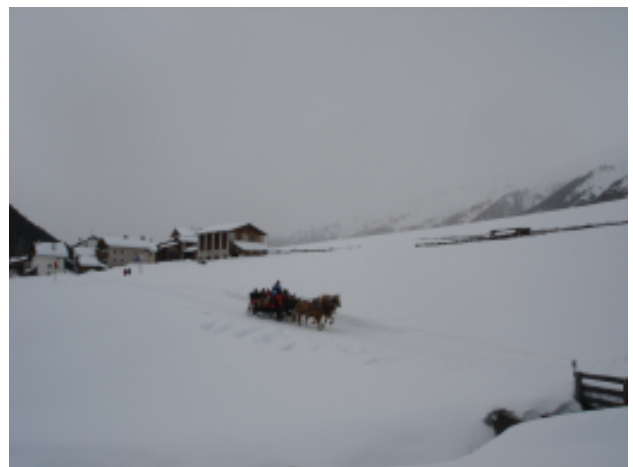
Auf zur Melager Alm