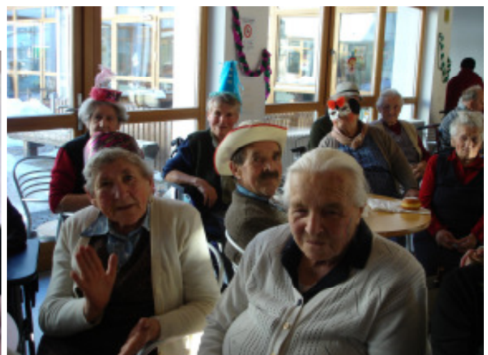
Einige Heimbewohner bei der Faschingsfeier