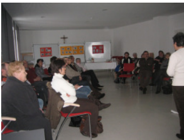
Rege Teilnahme am Informationsabend

Wir bedanken uns für die rege Teilnahme.