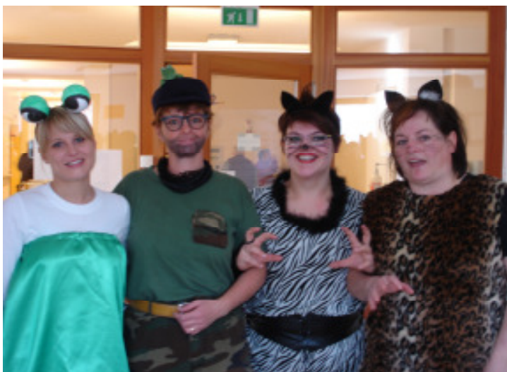
Buntes Treiben auch bei den Mitarbeitern