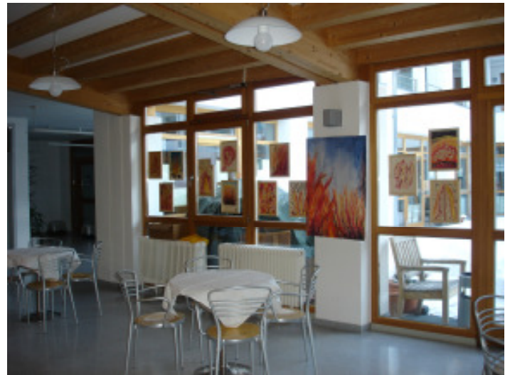
Im Bild die Bildergalerie im Barbereich